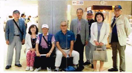
(見学終え館内で記念写真)

他にも色々展示があり一度では見きれないです。又、次回に来館してゆっくりと見たい声がありました。それほど作品が多いということですね。