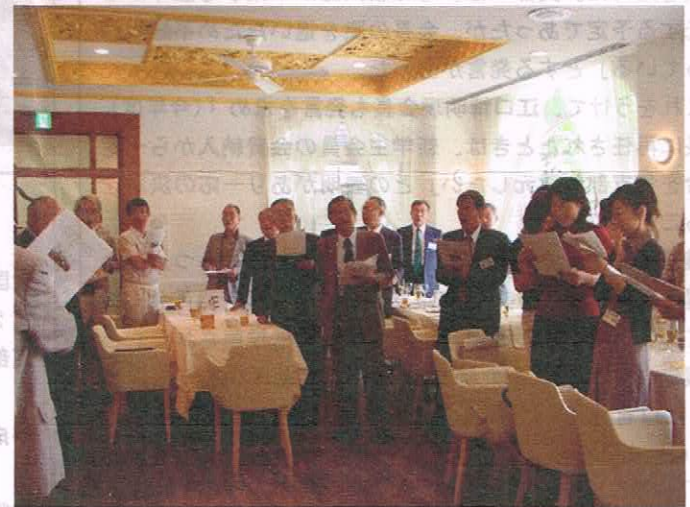
梅雨時にもかかわらず 天気晴朗 テラスで歓談