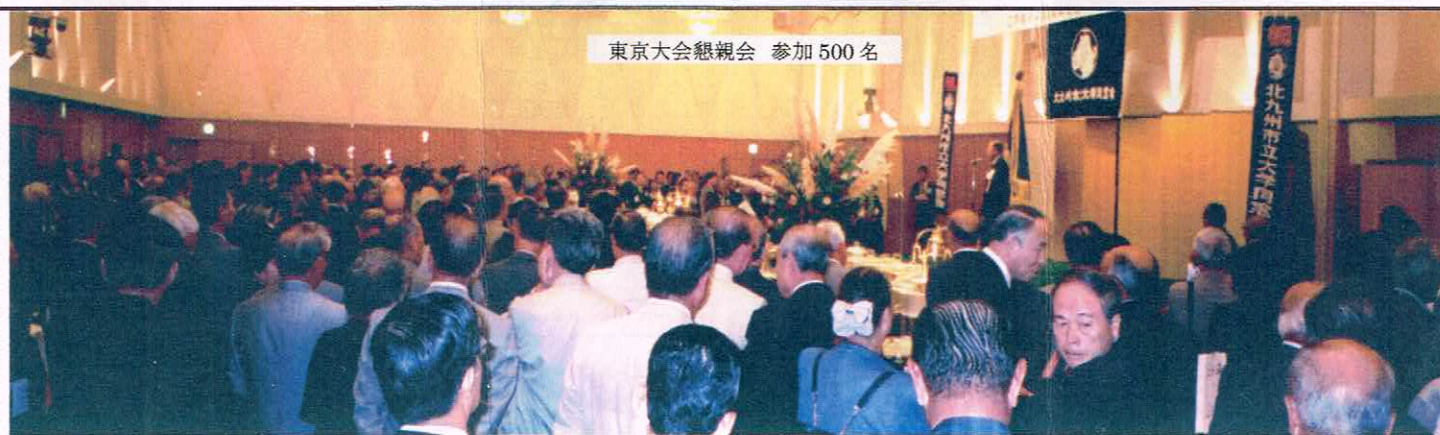
東京大会懇親会 参加 500名

以上の特例措置により、全同窓生の納入協力により、一層の連帯感を共有することができるとともに、さらなる同窓会発展への道が開かれるものと期待される。