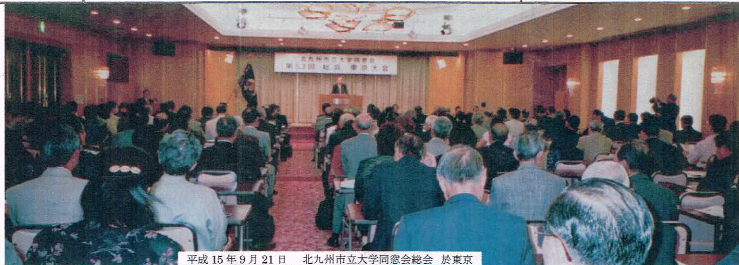
平成 15 年 9 月 21 日 北九州市立大学同窓会総会 於東京

購読料 12回 1,500円(送料込) 購読のお申し込みは郵便振替 振替口座 00980-2-245822 口座名:北九州市立大学同窓会兵庫支部