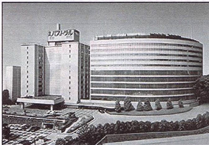
営団地下鉄日比谷線神谷町駅下車徒歩2分