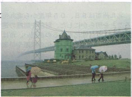
雨の中を移情閣に向かう

中国の革命家・政治家・思想家である孫文を顕彰する日本で唯一の博物館として、兵庫県が神戸華僑総会から