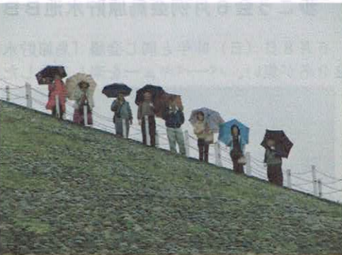
後円墳頂から降りてくる一行

五色塚古墳は4世紀の終わりから5世紀のはじめにかけて築造された兵庫県下最大の前方後円墳であり、全長194m、前方部の幅81m、高さ11.5m、後円部の直径125m、高さ18m。周囲に幅約10mの堀をめぐらしている。墳頂からの明石海峡大橋の