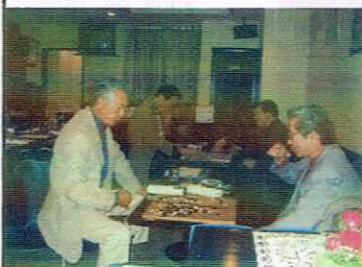
←囲碁の会風景/フリージア H15. 12. 19

心からお待ちしています。囲碁を打っている間は熱中のあまり、日頃の憂さも吹き飛んで相手の方ともすぐ親しくなり楽しい気分になります。私もいくつになっても向上心を持って、今より少しでも強くなりたいと願いつつ日々を送っています。