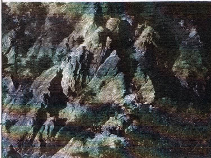
須磨アルプス「馬の背」