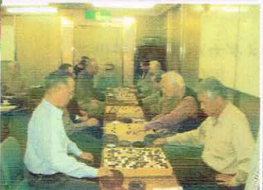
関西支部と囲碁交流会開催→ H15. 10. 25