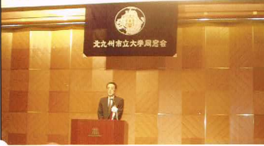
北九州市立大学同窓会

出場に際して各支部や同窓生諸氏からの500万円超の寄付に対するお礼、5月に会長就任し、役員を半数を入れ替え、支部長経験者の登用し、各支部との連携を