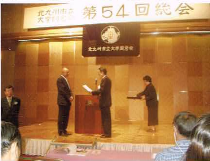
北九州市立大学同窓会 第54回総会

特等電動自転車から、11等日用品雑貨まで4人に一人は当る福引に歓声を上げ、小倉祇園太鼓の模範演技に、飛び入り