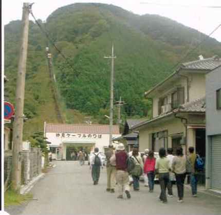
(ケーブル乗場に向う一行)

今回は妙見山頂上までの電車、バス、ケーブル、リフト全て込みで、三宮から1,500円という割安の周遊パスを利用したので、楽々と頂上近くまで上り、「歩こう会」としてはチョッピリ不満が残る往路となった。