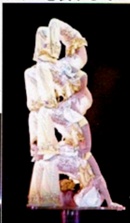
(5人が折り重なる 雑技団の演技)

雑技団も本物を観ると、TVで観るのは段違いの迫力であった。女性の柔らかいアクロバット、首の上に脚を担ぐように折り重なり、5人が巧みな照明と音楽の中で幻想的な演技であった。