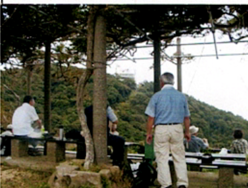
(昼食をとる参加者たち)

30分ばかりの昼食休憩。再び旗振茶屋に戻り、全員が揃ったのを確認して一の谷を目指す。