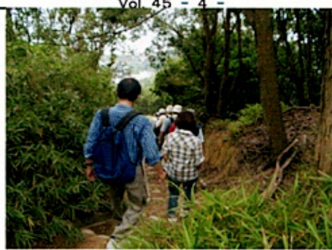
(一の谷の坂道を下る一行)

ふもとの住宅街まで一気に下りていった。須磨海岸にある「戦の濱碑」まで行く予定を変更して、安徳帝内裏跡方面へと直行。