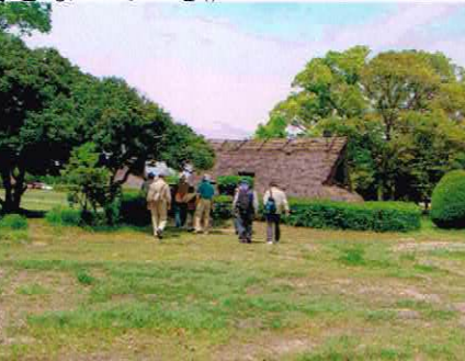
（弥生時代後期の住居を訪ねる一行）