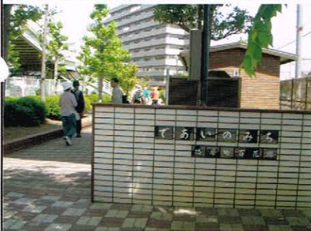
（であいのみち入口）

1923年（大正12年）多木製肥所（多木化学）の肥料や乗客を輸送する為作られ別府鉄道（土山～別府港）が、昭和59年1月廃線され、軌道敷跡地に作られた緑道「であいのみち」を通り、野添北公園（通称であいの森）