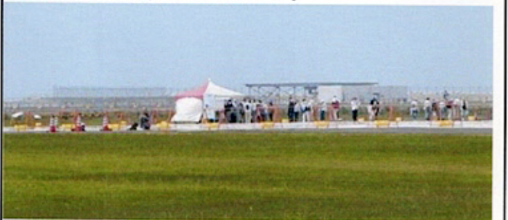
（工事中の空港ターミナルとポートライナー延伸線）