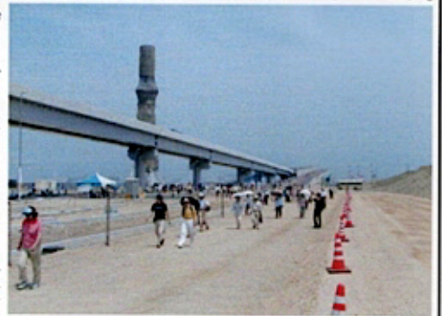
（ポートライナー延伸線沿いに歩く）に一足お先にご覧いただきたい。