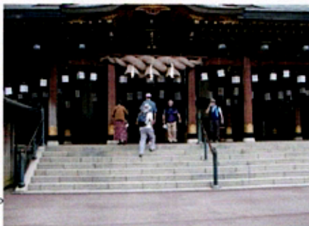
(鹿島神社で道中無事を祈願)

鹿島神社まで市街地から田園地帯と平坦な舗装道路を約40分歩き、鹿島神社で道中の無事を祈願して、境内横からの登山口から登り始めた。