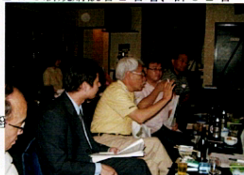
(活発に議論する三金会風景)