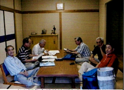
(9/2編集会議於神戸市青少年会館)

は、協賛者、広告出稿者、20周年記念総会出席者、寄稿者、同窓会本部役員、全国支部長及び大学の学長、理事長そして北方とひびきのキャンパスの図書館を予定している