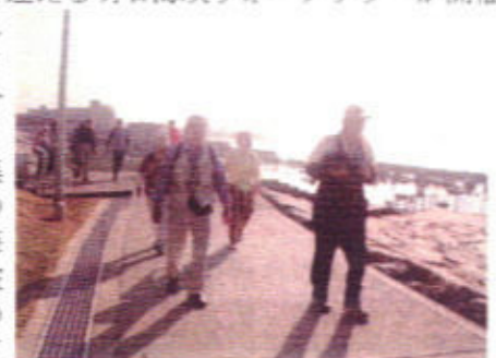
(明石海峡大橋を背に歩く)

され、事前に申込していた6名と、当日特別参加の6名の合計12名が早朝の8時にJR朝霧駅に集合して、17kmの大蔵コースを明石海峡の沿岸沿いに踏破して、無事ゴールの西二見のノーリツ工場広場に午後2時到着