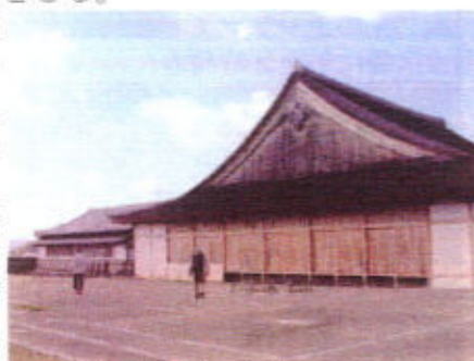
(大書院全景一南側から)

味まつりにやってきた車で大混雑している駐車場を横目に篠山城址へ上ってゆき大書院の入り口へときたが、入館せずそのまま天守閣跡地へ。大書院は京都二