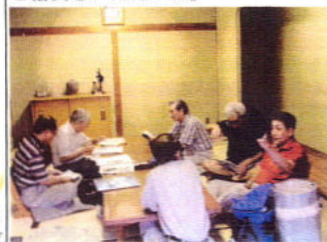
(編集委員会の模様)

全くの素人の集まりで試行錯誤を繰り返しながら、支部発足の10月に何とか完成させることが出来、記念事業協賛者をはじめ、7月に開催した記念総会への参加者、寄稿者、同窓会本部役員、全国支部長そして