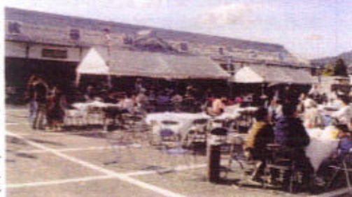
(味まつりで賑わう城跡周辺の広場)