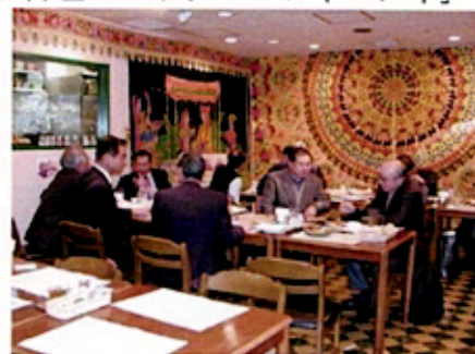
(飲むほどに酔うほどに席入り乱れて)

同氏は、都市交通電車用ブレーキシステムの組み立て・試験(検査)を行うために新設される現地法人の副董事長兼総経理(社長)として赴任されるのであり、同氏のご活躍を期待したい。