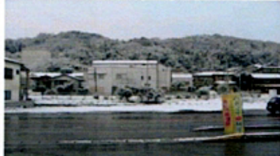
(昨春の大会当日の雪景色)