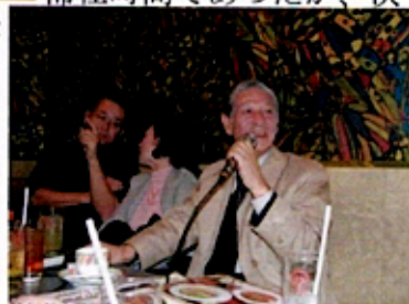
(姫路から駆けつけた永翁氏も)