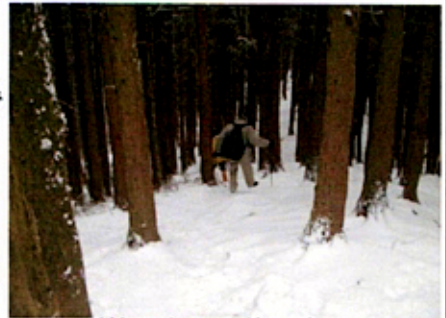
(林の中を雪道を踏みしめて)

観心寺は関西花の寺25ヶ所霊場の25番霊場であり、寒椿や紅葉のほか、さつき、百日紅などが見られるとのこと。楠正成が1336年神戸の湊川合戦で討ち死にした時足利尊氏の命により、正成が少年期に修業のため7年間過した観心寺に首級が送り届けられ首塚として祀られている。