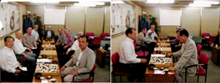
(前回第6回の囲碁交流戦風景)