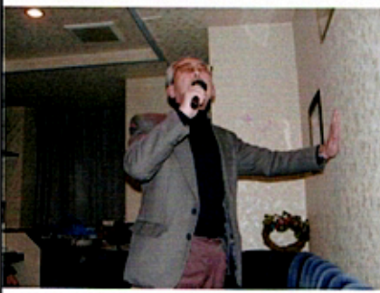
(三金会の後にはカラオケで楽しむ)

は、役員会ではありません。誰でも参加して頂けます。先輩・後輩の区別もなく、ざっくばらんに大学時代の思い出話や、健康問題やら社会問題やら、気楽に語り合っ、ストレス解消に役立てて頂ければと思っています。月例会費は3,500円となっています。会場はスナック「フリージア」で4ページの広告をご参照下さい。