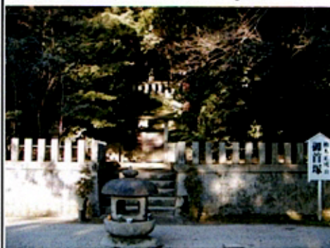
(大楠公楠正成の首塚)