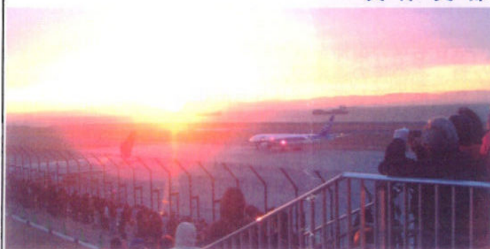
(神戸空港ターミナルビル屋上から初日の出と一番機 - 午前7時12分)

2007年の初日の出は午前7時05分、神戸空港滑走路を隔てた東の空、金剛山の隙間から素晴らしい輝きを放ちながらゆっくりと昇ってきた。