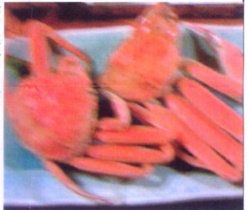
翌日 (11月26日) は早朝、津居山港で当日揚った私の仲間達のセリを見学した後、シルク温泉「やまびこ」でソバを食べたり、日本・モンゴル民族博物館を見学したり、又、安国寺の紅葉を鑑賞しながら帰宅するそうですが、来年も全員のオジサン達が元気に、(私のような霊にならずに) 津居山に戻って来ることを、只ただ、祈るばかりでございます。