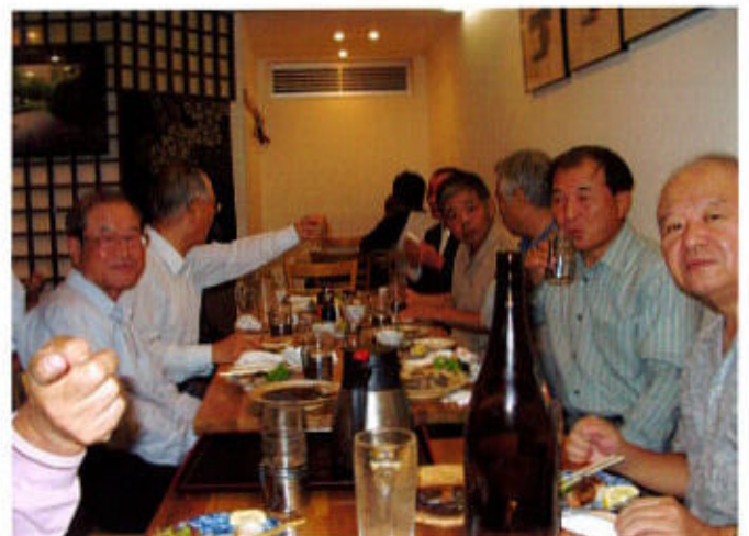
対局終了後懇親会