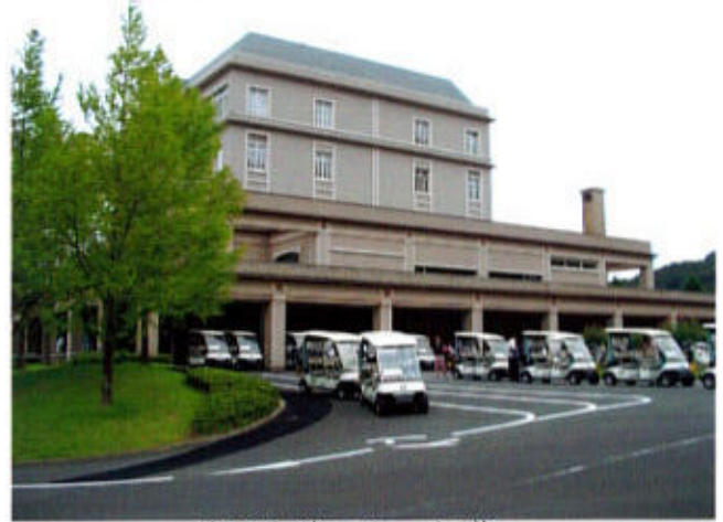
出発を待つカート群