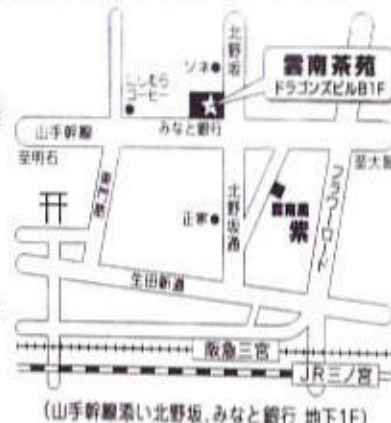
(山手幹線北野坂、みなと銀行 地下1F)