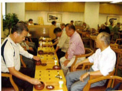
第9回兵庫・関西囲碁交流会風景