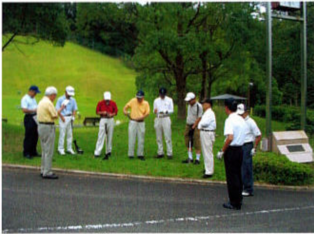
スタート前のミーティング