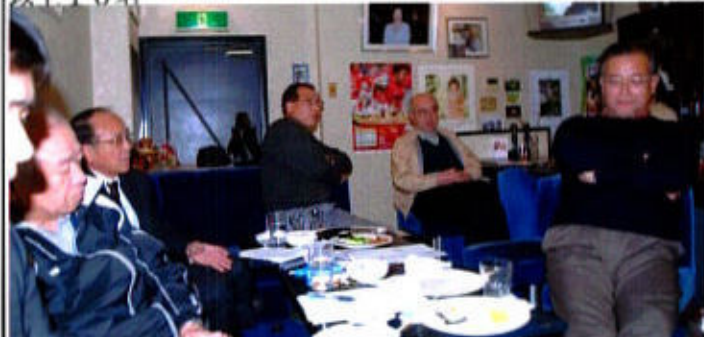
(三金会風景一議論中?休息中?)