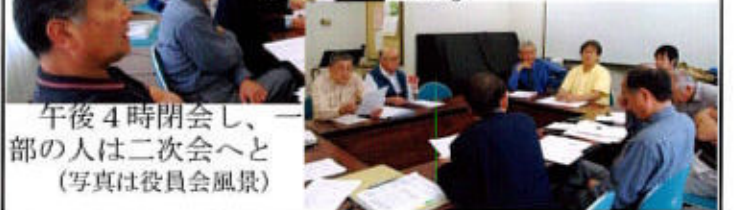
午後4時閉会し、一部の人は二次会へと (写真は役員会風景)

一般会計、新聞会計についてそれぞれ報告があったが、一部不備があり、修正のうえ、6月「三金会」で再報告することとなった。