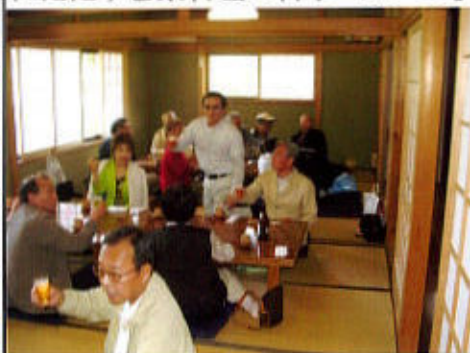
(「ぶへい」でのグルメ会)

買い物、飲み物で暫く時を過ごし、12時ごろ昼食予定の「ぶへい」からの迎えのバスに乗車し、約1時間、京は洛西の花の寺として知られる勝持寺山門横にたたずむ京料理の料亭「ぶへい」に到着した。