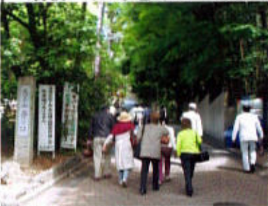
(美術館に向う一行)

本日の参加者は定員の20名とのこと。最初の目的地アサヒビール大山崎山荘美術館へ向う。