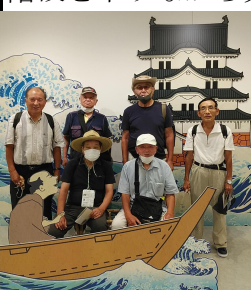
(平間・名越・松尾・安德・二宮・浜田)

義経・弁慶が西へ逃走の際船出した港が大物辺りにあったと記憶(違い?)あり更に東へと歩く。途中大物主神社(写真右)があり参拝し境内をうろうろしていると左の石碑を発見。船出前の数日をこの近辺で過ごしたようだ。ここで本日のウォーキングを終了。直ぐ近くの阪神大物駅へと向い、西と東に分かれて帰路に就く。