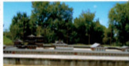
(広渡廃寺伽藍配置模型)

公園を後にして西へ約1キロばかり行くと広渡廃寺歴史公園に到着し、ガイダンスホールで休息。7世紀後半頃建立された古代寺院跡を歴史公園として整備されたもの。奈良の薬師寺と同じ伽藍配置だった由。園内には1/20の模型が展示されている。