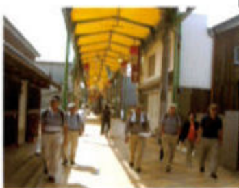
(旧商店街を通り抜ける)

175号線(旧道)に出て北上し、大池の側を通り市役所方面へ向かう道は、バイパスはまだ出来ていない頃中国縦貫道滝野社I/Cへ向かう時度々通った道で懐かしく感じる。