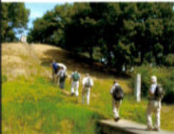
(王塚古墳に上る一行)

175号線(旧道)に出て北上し、大池の側を通り市役所方面へ向かう道は、バイパスはまだ出来ていない頃中国縦貫道滝野社I/Cへ向かう時度々通った道で懐かしく感じる。