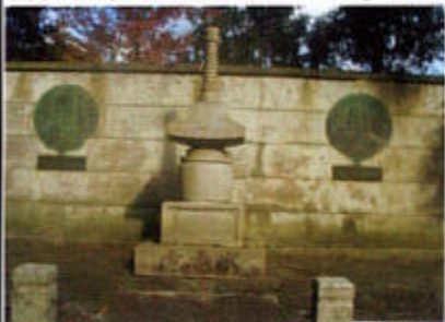
(電電塔とエジソン・ヘルツの肖像画)

偉大な功績を顕彰し、電電塔(中央)を建立し電気・電波の発展隆昌を願い、偉大な功績者の霊を慰めるという。又、本堂正面には狛犬ならぬ虎と牛が鎮座されていた。