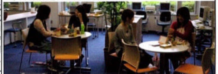
(学生プラザ風景 - 北九大HPより)

に本館に「学生プラザ」を設置し、学習・進路・就職生活・健康・悩みなど様々な相談機能を一箇所に集中し、ワンストップで学生相談に対応する体制を作った。また、学生の自主活動を支援するプロジェクト・ルームも併設した。開設以来一日約122名の学生が利用し、まさに「プラザ」の名に相応しく学生が日常的に集う場となっている。さらに、語学やゼミなどの少人数の必修科目を「センサー科目」として出席状況をチェックし、学生に不測の事態が生じていないか把握に努めている。昨年は、少数の学生の心身の不調を発見し、早期に適切な対応をすることができた。