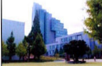
(北方キャンパス本館)

こうした改革の目標は、ひとえに、「教育の質の向上」にある。第二次世界大戦後の学制改革によって、国立、公立、私立の大学が多数開設された。その後、日本経済の高度成長、団塊や団塊ジュニア世代を核とする人口増加と進学率の上昇によって、現在大学は約740となり、大学進学率は52%と同世代の二人に一人が大学に進学し、入学者は実に約60万人に達している。日本の大学も、アメリカ同様、同世代の過半が大学生となる「ユニバーサル」段階に達した。この間、入学志願者増の波に乗って大学が増え続けたため一般企業と異なり、大学間の厳しい経営競争は避けられてきた。あるのは、若者世代の厳しい受験競争であり、偏差値による大学間の格付けがこれに拍車をかけた。大学もまた、経営の安定と大学間の格付けの固定化に甘えて、大学の自治を根拠に「教育の質の向上」のための経営努力を怠ってきたことは、否定できない。