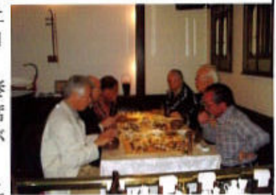
(熱戦を展開する囲碁の会4月例会)