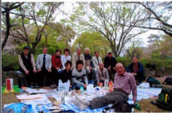
(花見の宴を終えて)

振る舞いですっかり酔いが回った事や、広島転居前の長岡夫妻も参加されていた事が思い出される。