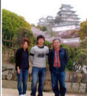
(安徳氏とご子息夫妻)

安徳氏のご子息は兵庫県内の社会人野球トップクラス新日鉄広畑の4番打者として活躍中である。佐藤夫妻は神戸在住で、山浦夫妻が海外旅行で知り合い「歩こう会」の存在を紹介され今回初めての参加となった。山浦夫妻は筆者とは元同僚で、寮生活をともにした間柄。九州佐賀出身で兄君は北九大出身と