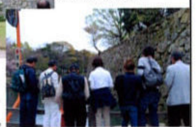
(お堀の鯉にご挨拶)

宴の後は腹ごなしと酔いざましの為、後藤・永翁両氏の案内でお城周辺の散策に出かけた。