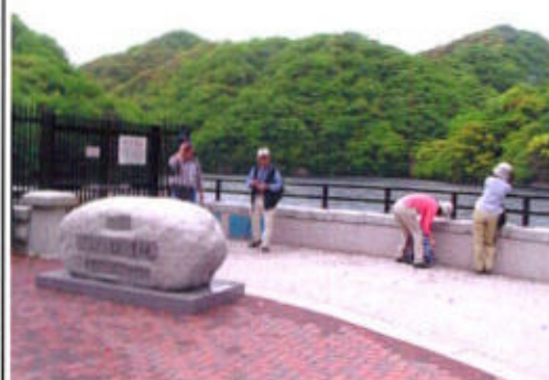
(五本松堰堤で小休止)

小休止の後、歩程一くぎりの布引ダムへ。途中珍しい作りの橋に出くわす。「猿のかずら橋」この橋を横目に見ながら左右の新緑に挟まれてやや登り勾配の路を一步一步踏みしめながら歩く・