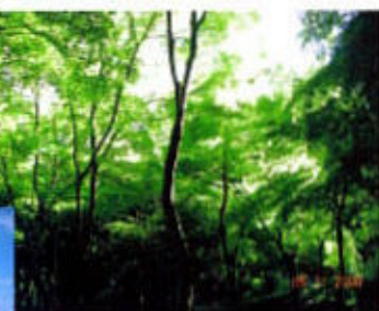
(新緑の香りを満喫)

残りの4人は公園内を通り抜け、諏訪山方面へ出る路を探りながら、少し右往左往して山手学園・県庁へとたどり着いた。