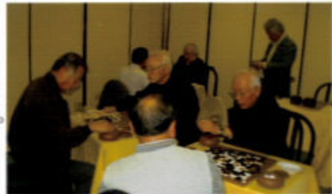
(全員そろって心リーグ戦に挑戦)