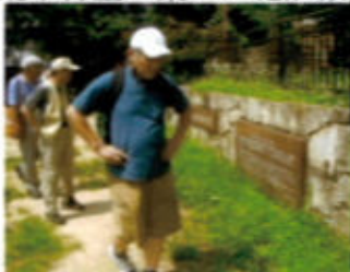
(花隈城社説明を読む一行)

1507年織田信長の命により荒木村重が築いた花隈城は、その後村重は信長に叛き1580年に落城。花隈公園として整備され花隈城社の石柱が立っている。近くの福德寺の門前に「花隈城天主閣之跡」の石碑がある。