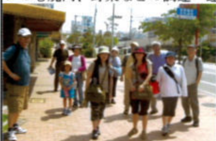
(JR元町駅から花隈城へ)

今回で6回目となる鳥原貯水池でのバーベキューは毎回好評である。H14年に第1回が開催され24名が参加、そしてH15年23名、H16年26名、H18年12名、H19年18名、今年は21名の参加となり、いつも焼肉、野菜などの調達・運搬を一手に引き受けて