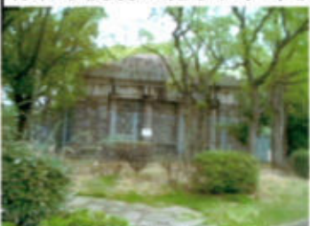
(伊藤博文公銅像の台座)

そこから北上すると15分位で関帝廟である。三国志で有名な関羽が祀られ、華僑の信仰を集めている。