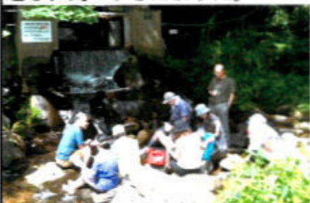
(川で涼をとりながら)