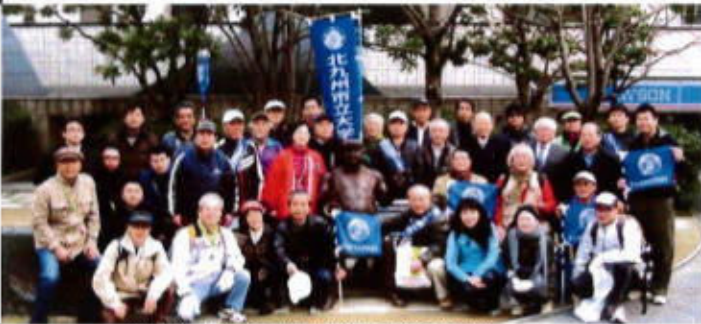
(福岡市役所前出発の記念写真)

3/11福岡支部からスタート、5/06北方キャンパスにゴール 3月号でお知らせしました通り3月11日福岡支部を皮切りに「同窓の絆たすき」支部リレー・ウォークがスタートした。出発式では本部役員や福岡県南支部長・小倉支部長等も駆けつけ、母校応援団のエールを受けて出発し、福岡市役所から大宰府天満宮までの約18kmを参加者45人が元気に歩き、福岡県南支部に「同窓の絆たすき」を引き継いだ。当日の様子は西日本新聞福岡県内版にも取り上げられ、写真入りで報道された。