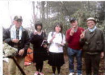
(鈴蘭台高校新聞班女高生2人と)

このイベントは何で知りましたか? 何処から来ましたか? 誰と来たのですか? など等インタビューに応じともにカメラに収まる。