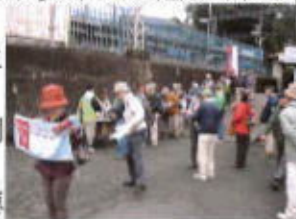
(箕谷駅前地図とタオルを)

国道428号線を三木方面へ(西へ)向かって歩き、途中から田園地帯を走る地方道へと入って行く頃には小雨がぱらつき始めた。やがて道路脇にある「新兵衛石」が目に入り、傍らの説明板では、15歳の庄屋の息子村上新兵衛が通りがかった領主に直訴、その勇気を賞され罪を問われず年貢の軽減も聞き届けられ、村人は喜び記念の石を置いたとの事。