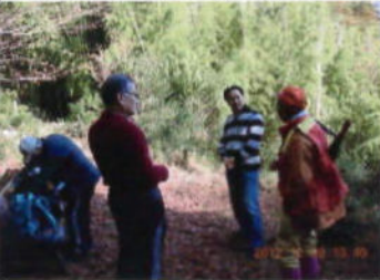
(猟友会の方と歓談)

程度登った青い竹林の中を背にして、紅葉で敷きつめたベンチで休憩を取り、猟友会の方と歓談。猟銃は、通常80mの射程距離だが下り斜面だと300mになり、非常に危険な為慎重に扱われているとの事。また