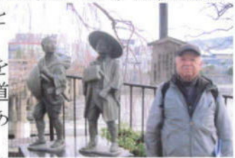
(弥次喜多立像の前で)

第1回は初回ということだろうかからか、比較的短い距離である。お正月のお餅とお酒で体重が増えつつあり、懸案の穴埋めウォーキングをと、阪急河原町駅から東海道五十三次の終点(起点)である三条大橋へとやってきた。