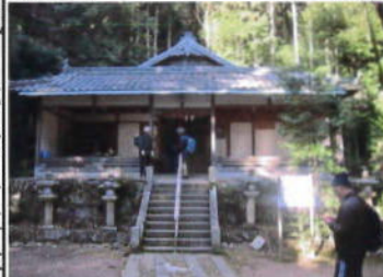
(吉川八幡神社に参拝)

若きトップ！ 一方の私は、足を踏みしめながらマイペースで踏ん張りながらも時々滑りながらも、何とか下山する。