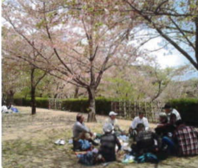
(名残花3分の桜花の下で)

姫路城西の丸高台にある千姫ぼたん園の桜の下で、差入れのお酒や肴・お弁当を楽しみながら歓談しました。