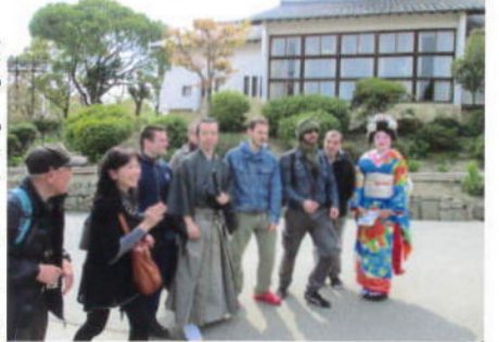
(龍馬とお龍と外国人観光客と)

龍馬とお龍の時代衣装に扮装した方や外国人観光客を見かけ、流暢な外国語(ボンジョルノ・コメスタ?ペーネ・グラツェ)と会話する先輩方の姿を拝見しおもてなしの心を学びました。