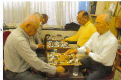
(囲碁交流会対局風景)

終了後は「三金会」と合流して懇親会。当日の成績は下記の通り。(兵庫関西の対局のみ集計)