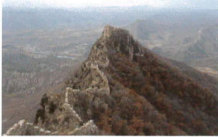
(北京郊外の万里の長城)

北京駐在中、「燕京山の会」に加わり各地の万里の長城に登っていました。帰国後、その仲間達が関西支部を作り、近郊の山歩きをしています。