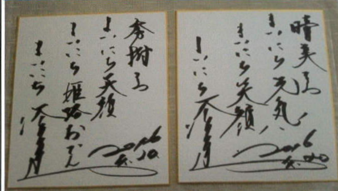
(松岡修造さんの色紙)

http://www.fuittv.co.jp/kuishinbo/movie/index.html