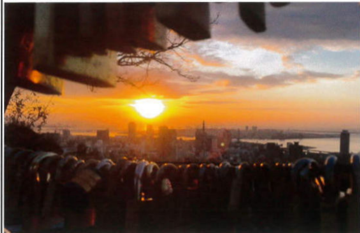
(無数の鍵が取り付けられた「愛の鍵モニュメント」の隙間に見える初日の出)

今年の歩こう会恒例の初日の出は年末年始の好天が続く中、雲が薄くほぼ予定の時間に遥拝する事が出来ました。場所は神戸元町の北にある諏訪山公園の中腹にあるビーナスブリッジです。メッセージや願い事を書いた南京錠を自由に付けられる「愛の鍵モニュメント」が作られ、毎年数千個の「愛の鍵」が掛けられています。