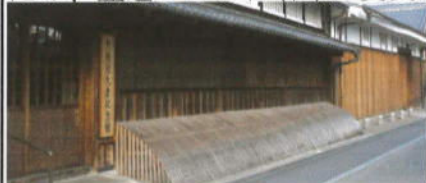
(月桂冠大倉記念館)

「歩こう会」は毎月第2日曜日に実施してきていますが、8月の第2日曜日は13日のお盆の最中となるため、翌週の20日(日)に変更されました。