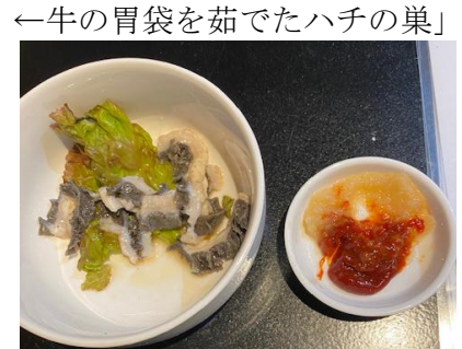
←牛の胃袋を茹でたハチの巣