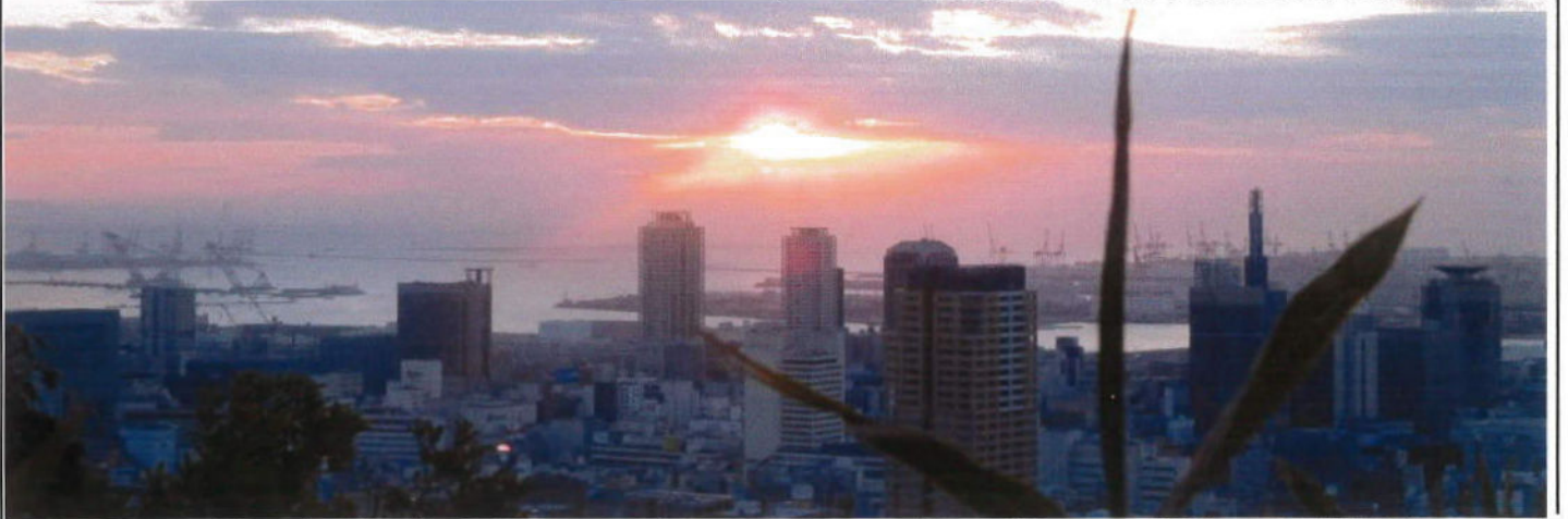
(神戸港に昇る初日の出 諏訪山公園ビーナスブリッジより)