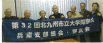
第32回北九州市立大学同窓会 兵庫支部総会・懇親会