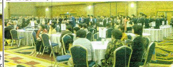
(女性席も設けられた懇親会会場)