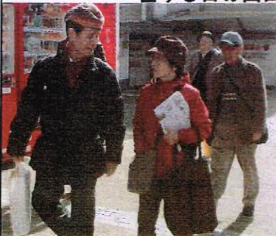
平成29年3月 「歩こう会」3月例会 神戸タウンウォッチングに参加、(右端)