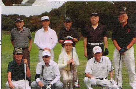
平成29年9月 三金ゴルフコンペ @東条の森CC (後列中央)