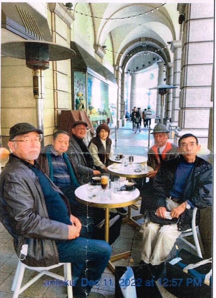
antoku Dec 11, 2022 at 12:57 PM