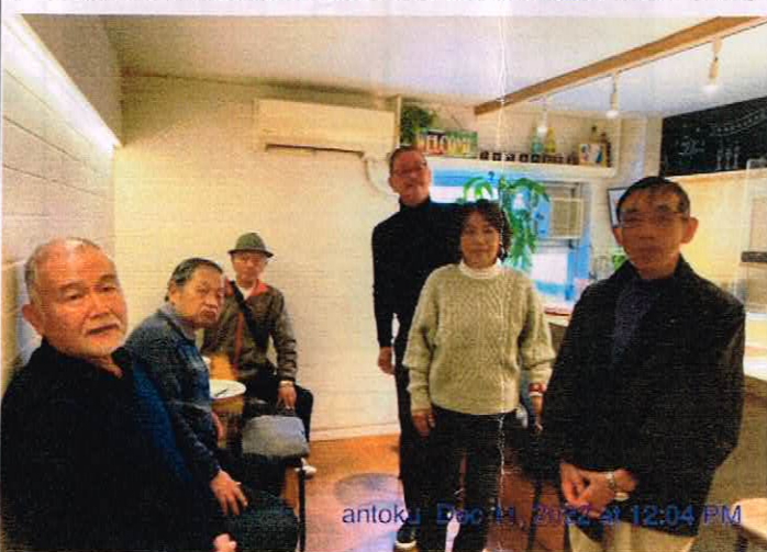
(安徳、松尾、永翁、牛丸夫妻、濱田)

ドリンクメニューに唯一あるビール、シンガポールから輸入されたTiger Beerは料理と相性が良かった。