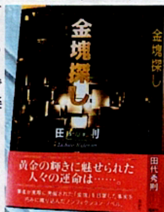
『金塊探し』表紙と帯紙