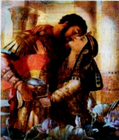
(クレオパトラ七世)

やがて大王がヨーロッパへ去ってしまい「プレトマイオス王朝」として辛うじてファラオの命脈を保っていたが西暦紀元の頃に、ローマのカエサルやアントニウスとの情事で名高い女王クレオパトラ七世の治世を最後にローマ帝国に併呑され、実に五千年もの長きに及んだファラオの王史も幕を閉じた。