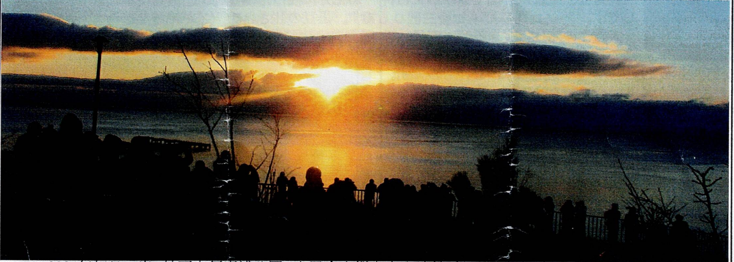
2024年初日の出、神戸市須磨浦公園、六甲全山縦走出発地付近より 令和6年1月1日午前7時25分

皆様のご健康とご多幸を祈り 兵庫支部活動のご支援よろしく願い申し上げます 北九州市立大学同窓会兵庫支部役員一同